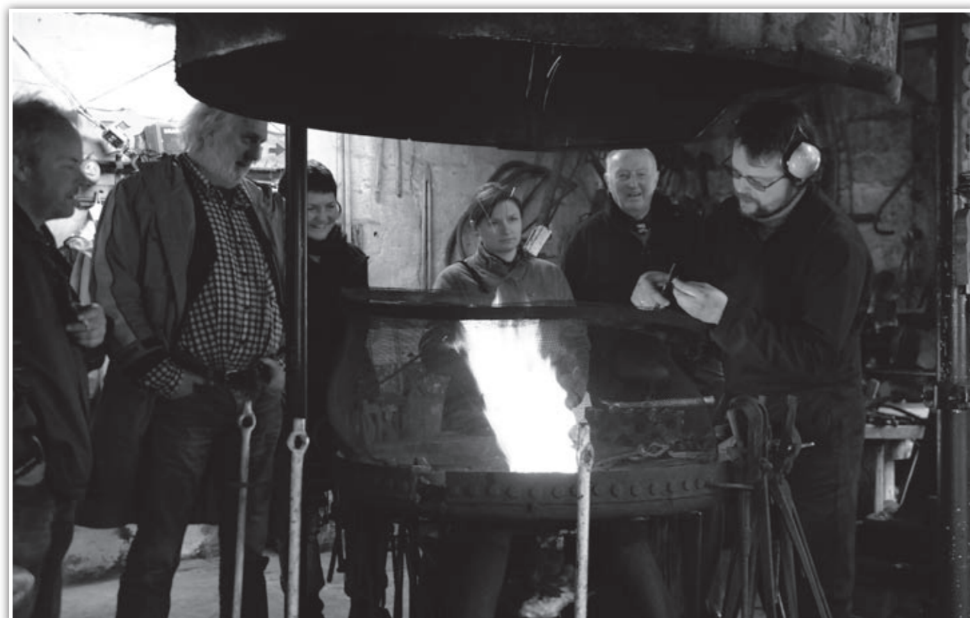
Smed og entertainer