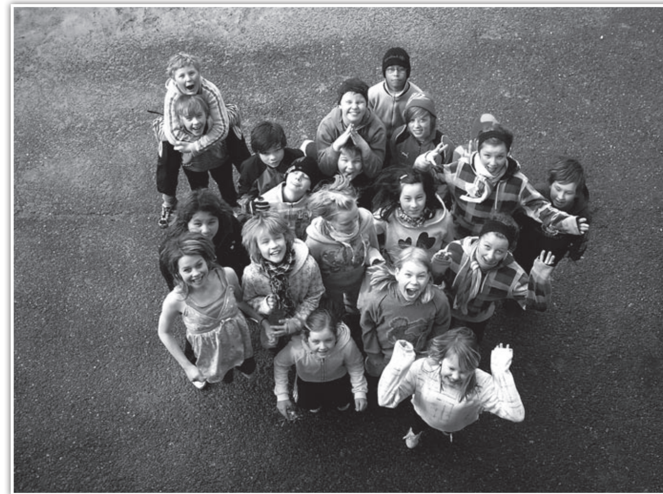
6. klassen på Kjøllefjord skole er med på filmprosjektet Tweens.