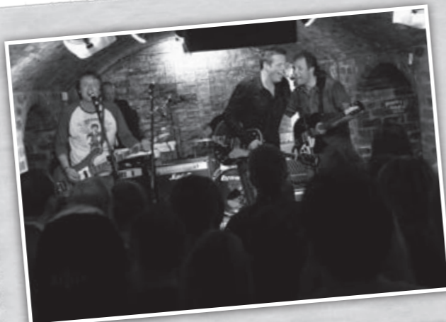
The Norwegian Beatles.

«Blues er ikke trist musikk, blues er musikalsk terapi, musikk som skal gjøre dagen litt lysere og humøret litt bedre».