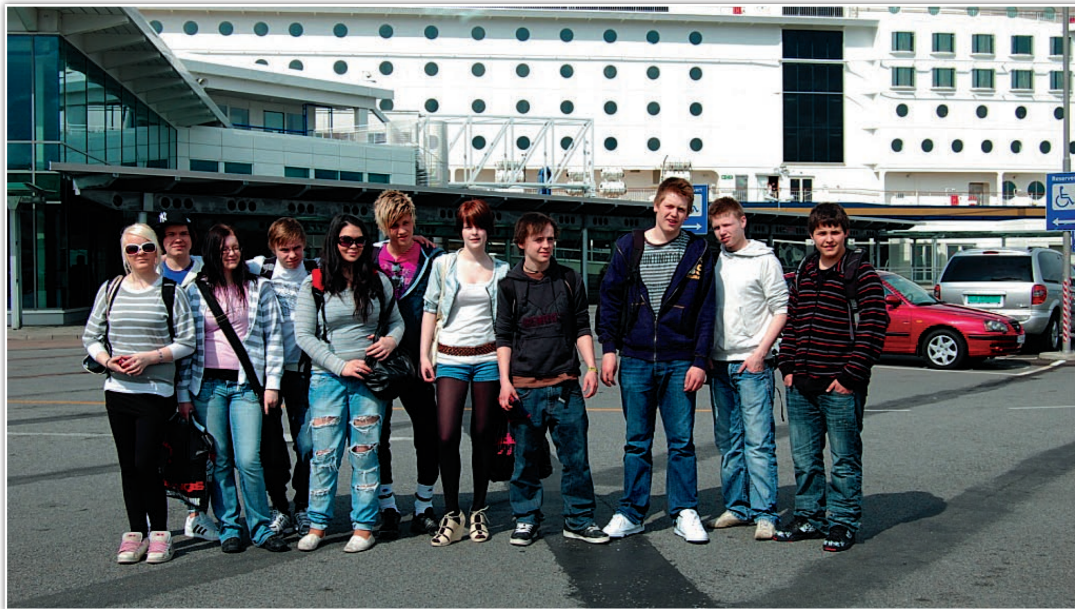
10. Klasse, med Kiel-ferga i bakgrunn.

var direkte tortur. Ingenting var umulig og gjennomføre for Mengele, fordi alt gikk under, vitenskapelige forsøk, eller forsvar for den ariske rase. Torturmetodene var blant de verst tenkelige, og de mest brukte var operasjoner og amputasjoner av kroppsdeler uten noen form for bedøvelse, men også fysiske og psykiske tester, for å finne ut hvor mye menneskekroppen tålte, blant annet; kulde, varme, oksygenmangel, sult.. m.fl.