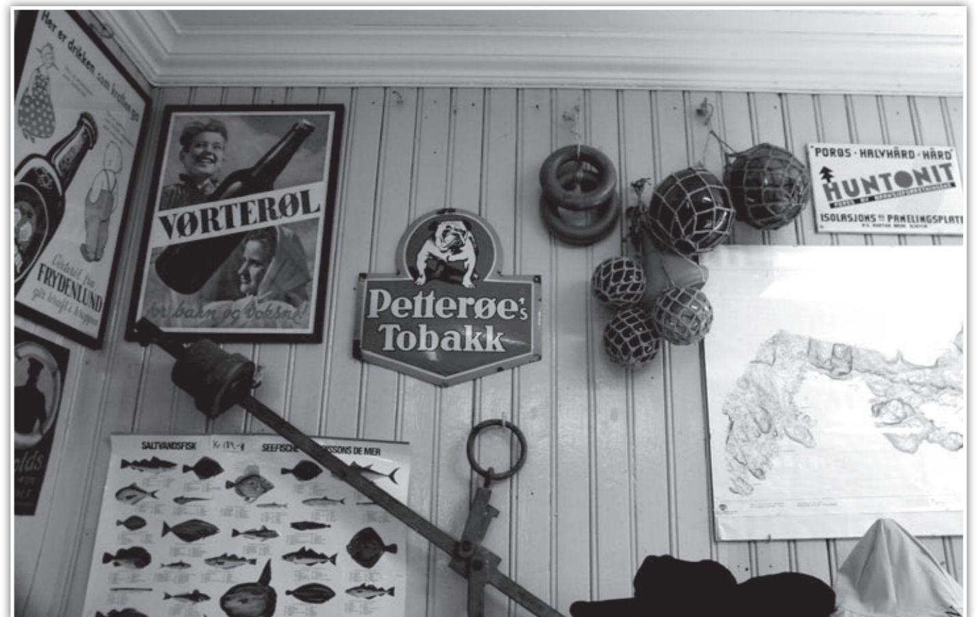
Hummer og Kanari på landhandelen i Nusvåg.

Vår endestasjon, Å i Lofoten er åsted (he-he) for ikke mindre enn to private museer med svært engasjerte innehavere. Norsk Tørrfiskmuseum ble åpnet i 1993, og drives uten offentlige tilskudd (- Ja, æ har nu ikke søkt heller...), etter at den ordinære produksjonen på anlegget ble lagt ned. Her legger man vekt på at alt skal være så autentisk som mulig – og det lykkes – mottaksbrygga ser ut som om arbeiderne bare har tatt femminutt. Ingen båter, bilder, linebruk eller annet fjas som ikke hører naturlig hjemme på mottaket her nei!