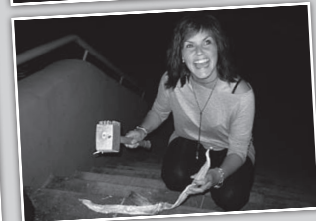
Norsk snacks klargjøres.