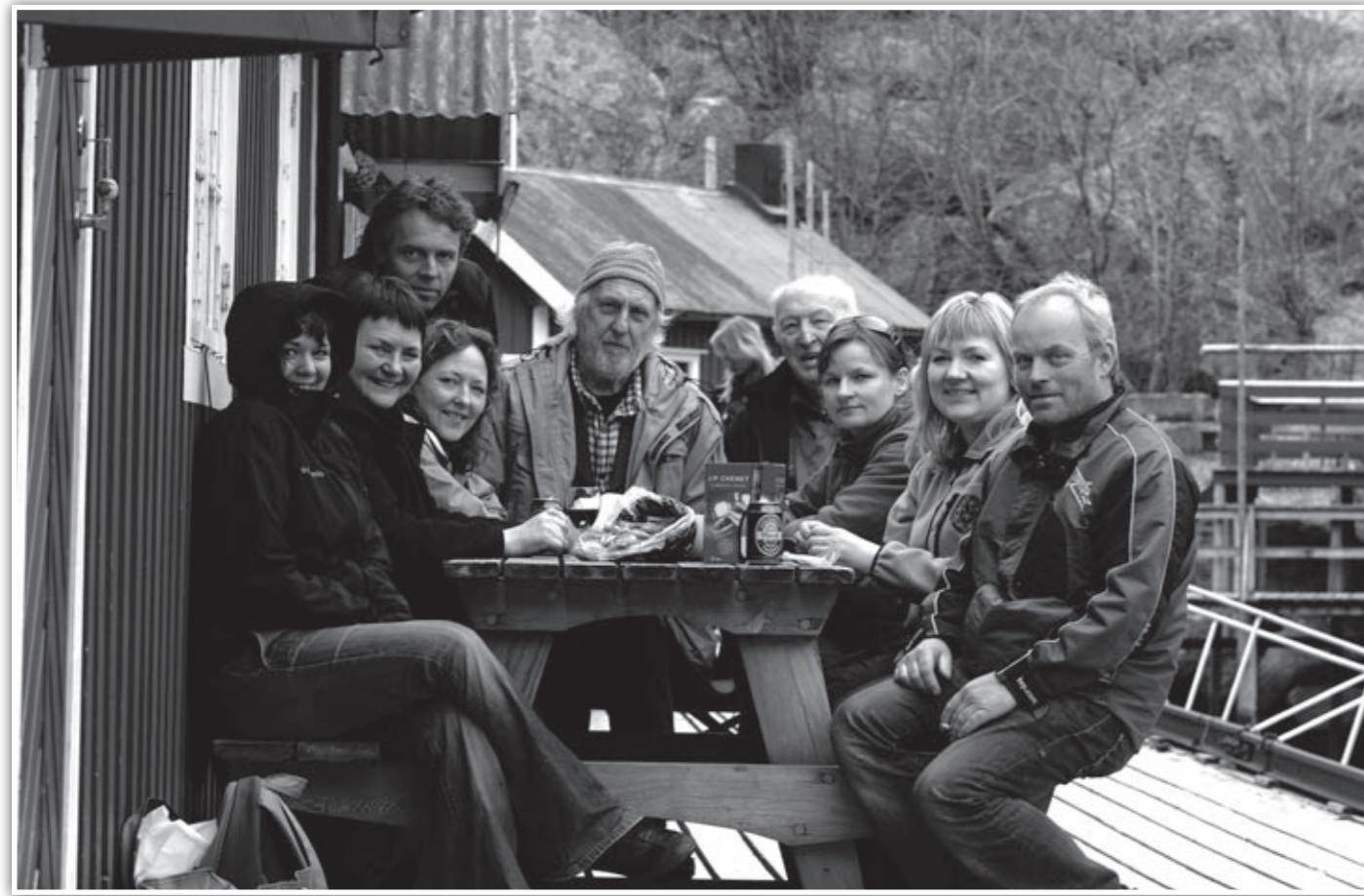
Kystlaget på tur