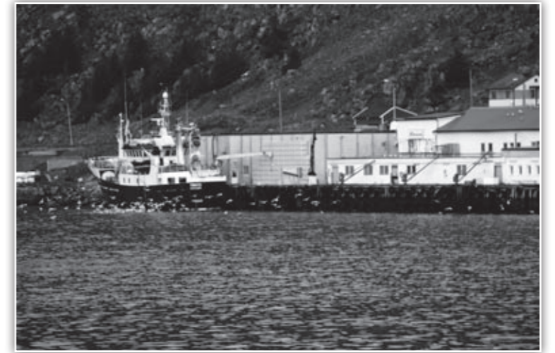
Aker Seafood har knyttet til seg flere båter som leverer levendefisk.

Svikten i markedet har også resultert i langt dårligere prisen på fisk enn hva som er blitt betalt de siste årene. Nå er man tilbake på samme nivå som i 2005, og som av mange