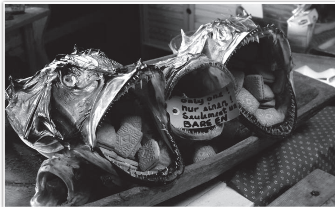
Lofoten original servering av småkaker

Mandag kveld var vi endelig tilbake i Kjøllefjord "og alle var enige om at det hadde vært en fin tur"!