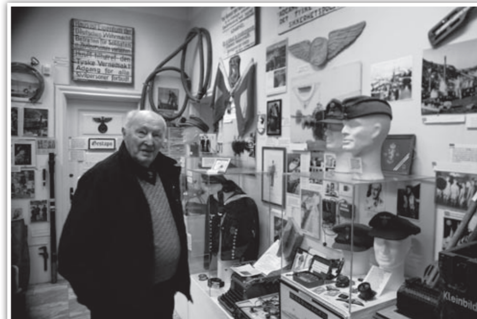
Knut på krigsmuseet.

Ved kai i Svolvær lokaliserer vi tilslutt "Symra", vakker gammel trebåt fra Kjøllefjord, som nå fungerer som lekeplass for actionhungrige grupper av bedriftsledere som har opplevd det meste fra før. Selskapet drives av noen riktig