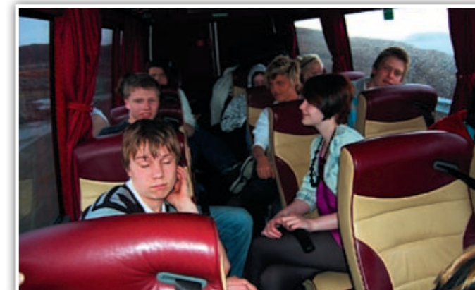
På tur hjem til kjøllefjord med taxi fra Alta. Snart er turen over.