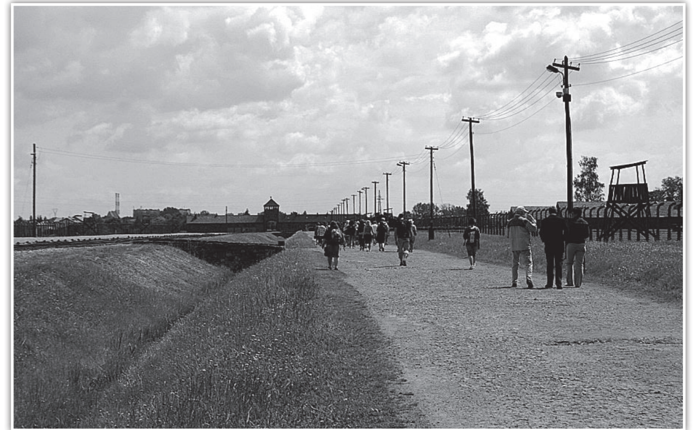
Guiden viser hvordan fangene ble hengt etter armene med tau, fast i i toppen av pålen. Etter noen timer slik, gikk skuldrene ut av ledd. Noe som selvfølgelig var meget smertefullt.