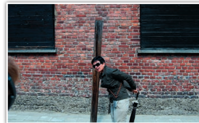
Vi blir guidet rundt i leirene.. her i Auschwitz.