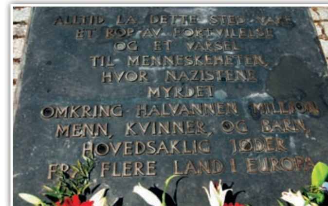
Et av minnesmerkene / monumentene i Auschwitz

Turen gikk omsider tilbake igjen til Norge, innom Berlin, og et badeland Tropical Island. Turen var både trist, fin, morsom og skummel på en og samme gang. En meget spesiell opplevelse, som anbefales for alle. En sitter tilbake med inntrykk og minner som er helt ubeskrivelige. Jeg har vanskelig for å tro det som har hendt i leirene, men jeg har jo vært der og sett det selv. La dette være et høyt skrik til hele verden, om at dette aldri må skje igjen.