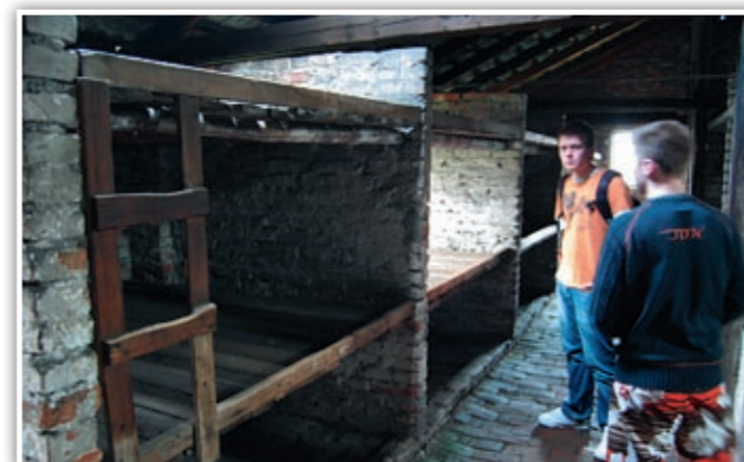
Senger i brakkene hvor fangene bodde.