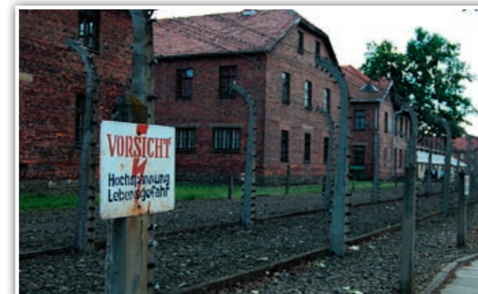
Et bilde fra fangeleirene.

Men det skjer.. Mange mennesker blir drept og torturert, og bare de aller færreste får omverdenen høre om.