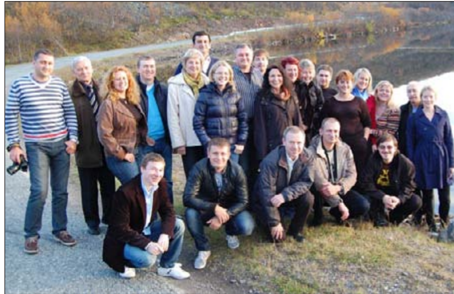
Den russiske delegasjonen som gjestet Kjøllefjord Vindpark.

Noen har kanskje lagt merke til stålporten som er satt opp ved ekspedisjonskaia. Tiltaket er en følge av at kaia måtte godkjennes i henhold til ISPS-regelverket (International Ship and Port Facility Security Code).