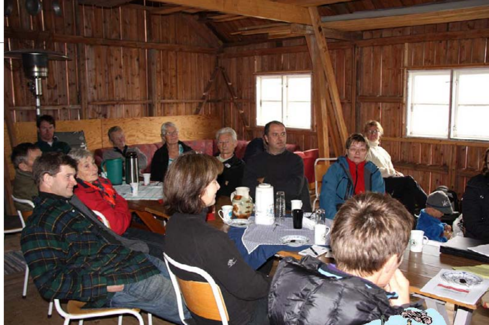
Mange møtte opp på Kråbøl gård da fylkesmannens landbruksavdeling besøkte Bekkarfjord.

«...økt rekruttering, tilvekst i lokal flåte, generasjonsskifte og Kjøllefjord som attraktivt fiskevær for fremmedflåten.»