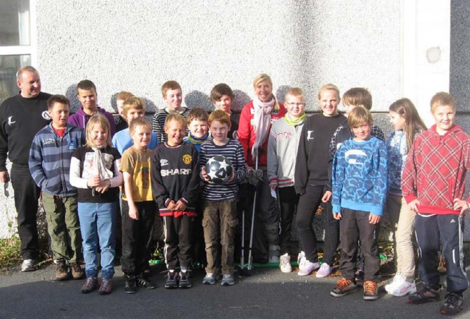
Skiskytterne i Kjøllefjord fikk treningsråd av selveste Kristin Størme Steira - før de går i gang med vinterens treningsøker.