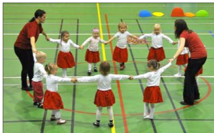
Turn er en populær aktivitet også for de minste.