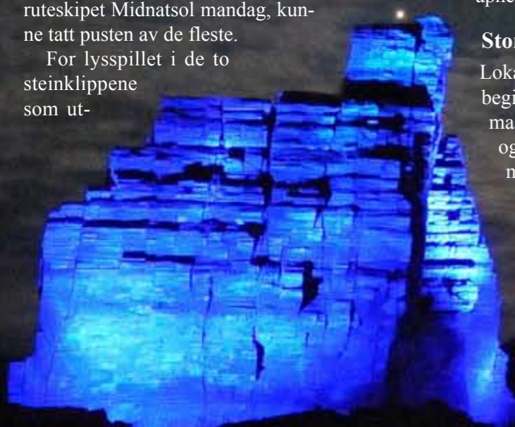
Finnkirka i full belysning. Et spektakulært skue for hurtigrutepassasjerene.

Med Finnkirka som et framtidig høydepunkt langs leia, blir det neppe mindre viktig de kommende årene.