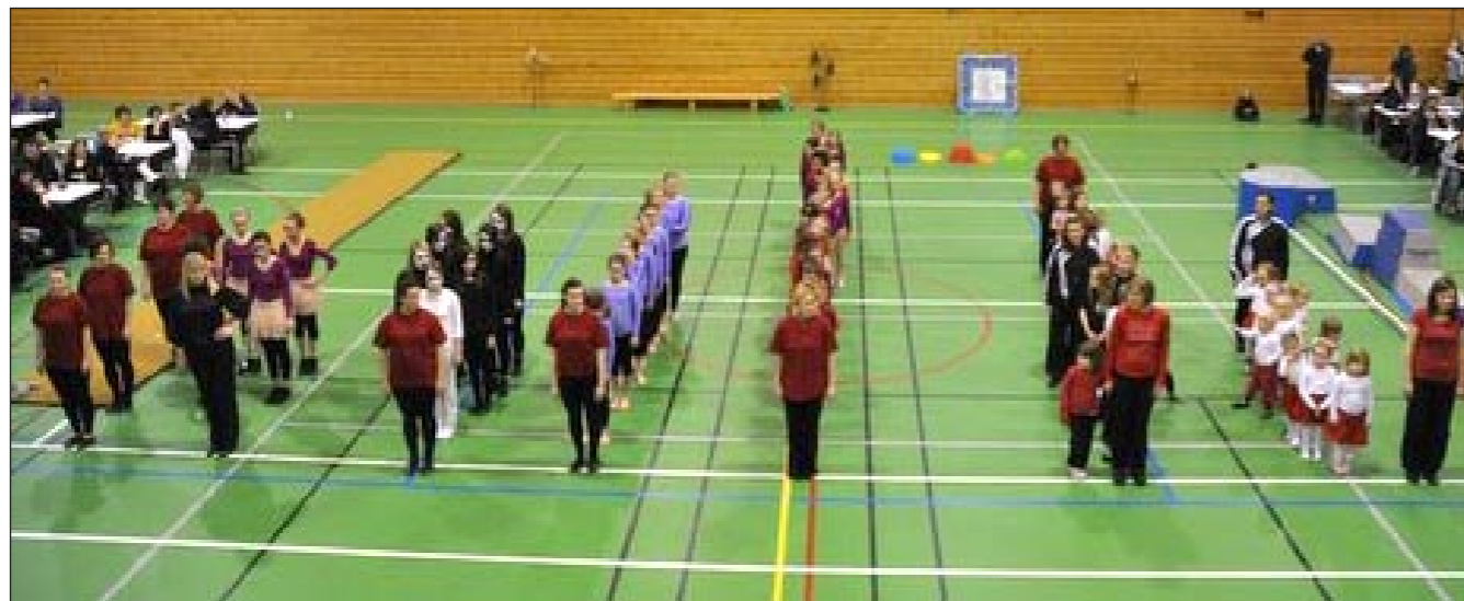
Over 60 utøvere er aktive turnere i Kjøllefjord.