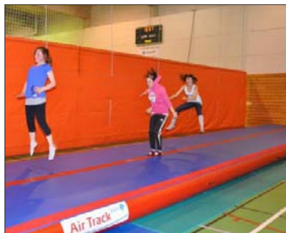
I år har turnerne fått en såkalt air-track å boltre seg på.

Siste skudd på stammen er en såkalt «Air-track», dvs en oppblåsbar bane, som kanskje kan sammenlignes litt med ei trampoline for de som ikke har vært borti den. Banen er ca 3 meter bred og 15 meter lang, og man gjør de samme øvelser på denne som på matte. Fordelen er at den er fylt med luft, man slår seg ikke, og man tør å ta mer sats i det man skal gjøre. Flere av trenerne har kurs for å kunne drive trening på denne, og i løpet av oktober skal denne tas i bruk for alvor. Vi oppfordrer spesielt gutter til og «komme på banen!»