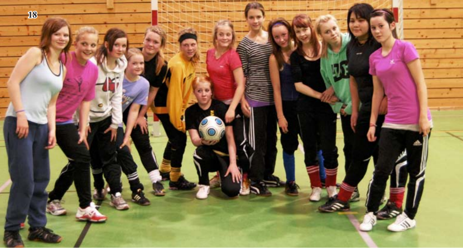
Kjøllefjord har endelig fått eget jentelag i fotball.