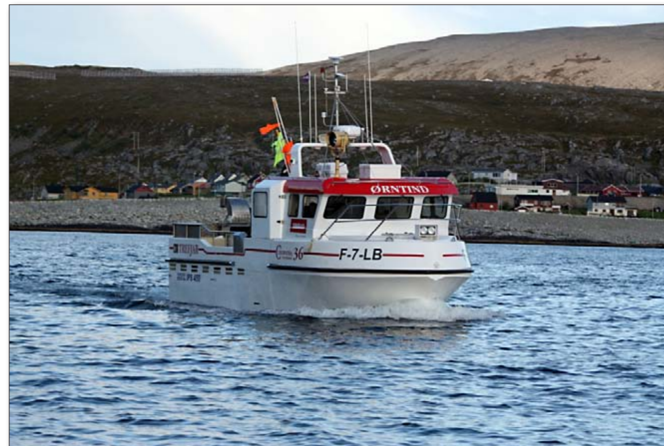
Fiskebåten Ørtind som sammen med Vårliner og Striptind utgjør rederiet Striptind AS, har skapt en turistsuksess med havfisketilbudet.