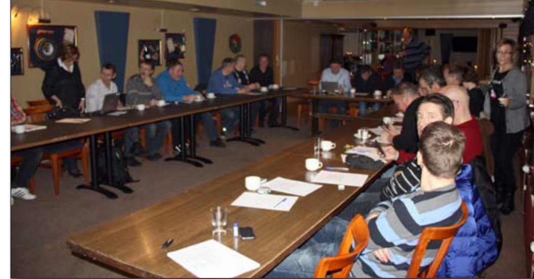
Det var stor interesse da fiskerieringa ble diskutert.