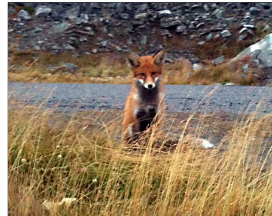
Kommunen advarer mot mating av rev. Dette er ville dyr som ikke har noe i tettbebyggelsen å gjøre.