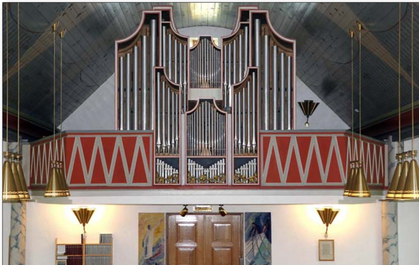
Her er galleriet i Kjøllefjord kirke før og etter nytt orgel.