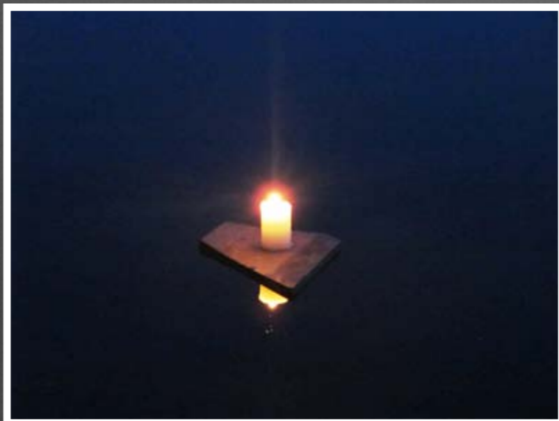
Lys på vann.