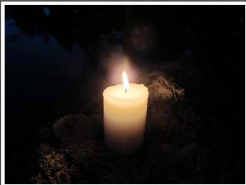
Lys på stein.