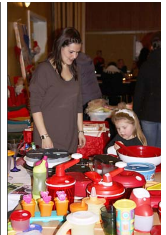
Elethe på jakt etter julegaver.