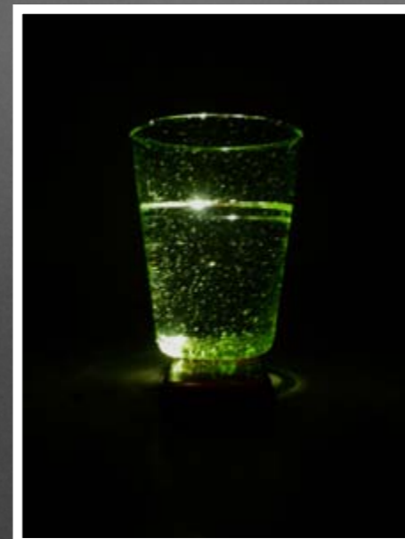
Uten tittel.