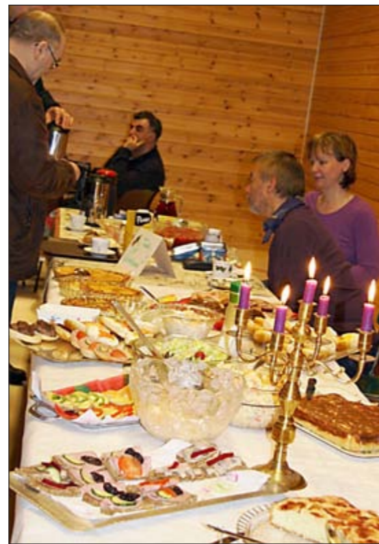
Fristende servering i Dyffjord.