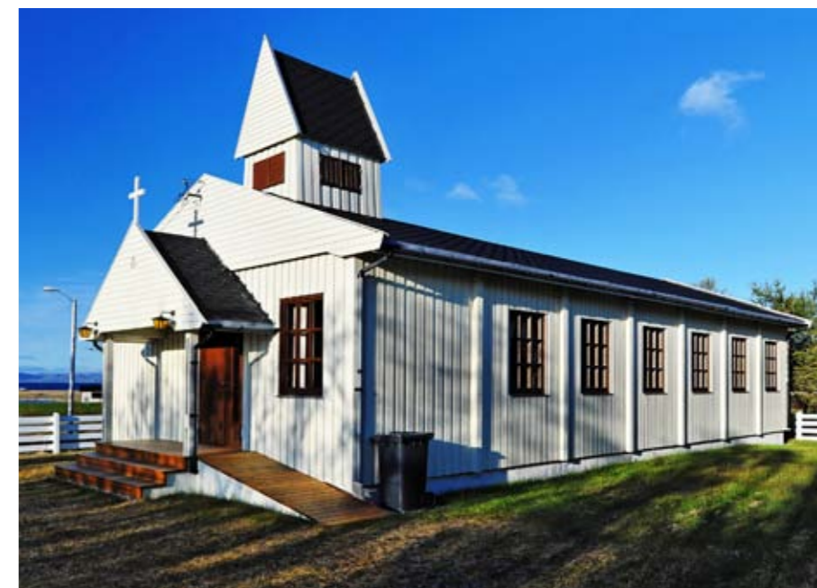
Veidnes kirke skal ha nytt taktekke.

Vi gratulerer 9. trinn i Lebesby kommune som gjorde det svært bra på nasjonale prøver i matematikk. De flinke elevene presterte bedre enn både fylkes- og landsgjennomsnittet.