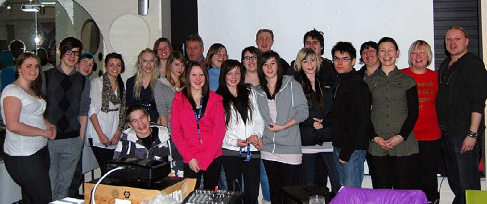
Grenseløse forbindelser med ungdom fra Nordkyn og Finland.