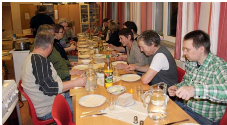
Møljekalaset ble en ubetinget suksess.

alet og enkelte spesielt inviterte gjester fikk gleden av å bli oppvartet med vinterens absolutt beste måltid. For noen var dette også det første møtet med mølja og nord norsk mattradisjon. Og for de fleste var dette et kjærkommet avbrett i de vante rutine.