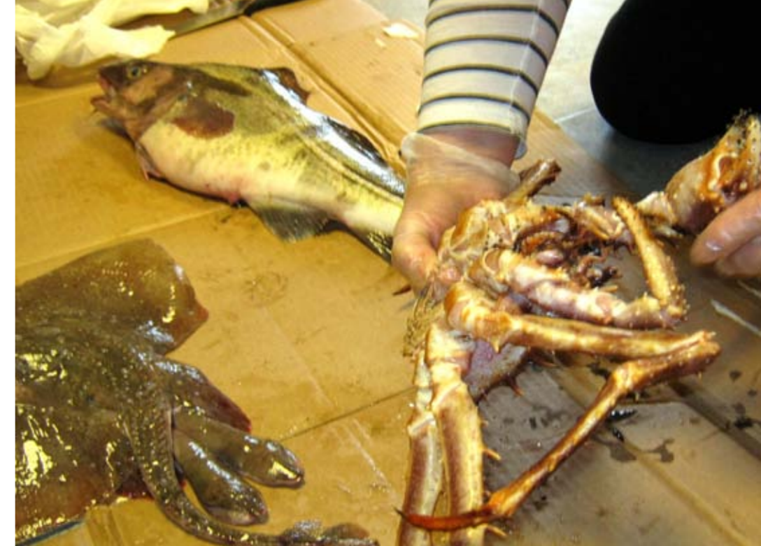
Krabbe, Skate og Torsk