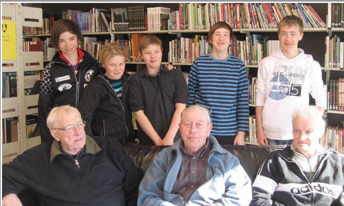
Gammelgutta har jevnlig besøk av skoleungdom.