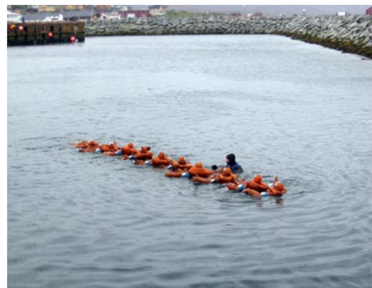
Til slutt bar det i havet med samtlige.