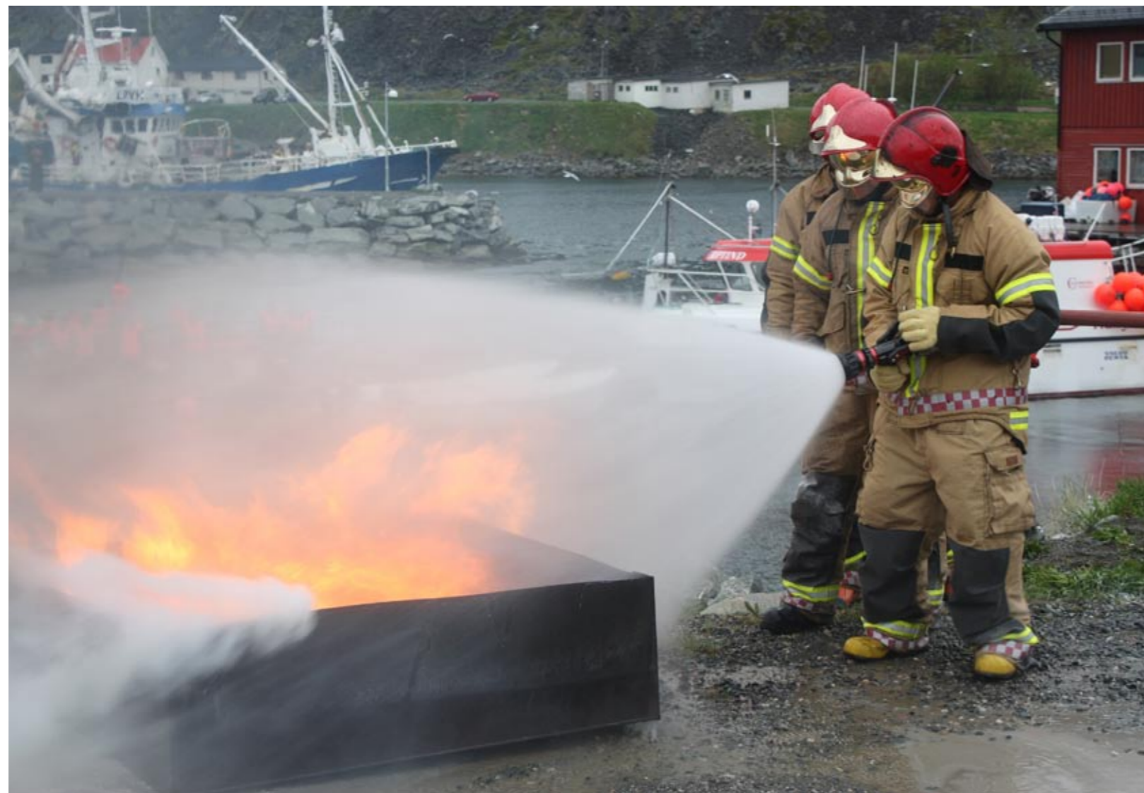
Deltakerne fikk teste ut brannvesenets slukkeutstyr.