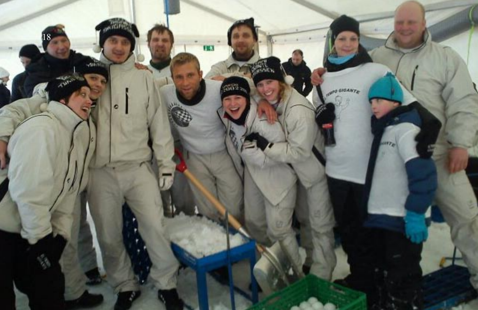
Iltempo vant snøballkrigen for 3. gang