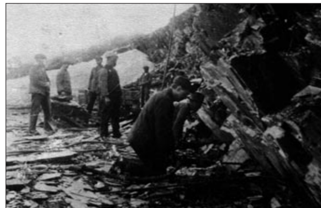
Skiferdrift, Friarfjord 1918, fra "En bildesamling fra Lebesby kommune", utgitt 1978.