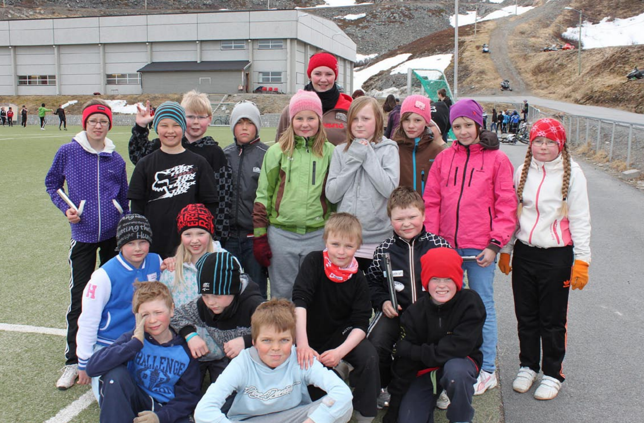
5. klassen var med for første gang.