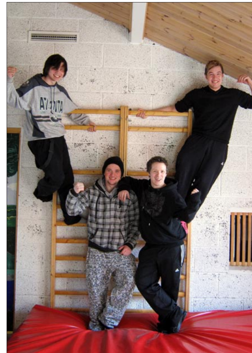
Rekruttering av menn i Galgenes barnehage

med en mann i barnehagen. Det Må flere menn inn.