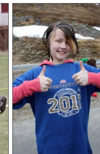
Maia heiet selvfølgelig vinnerne fram.