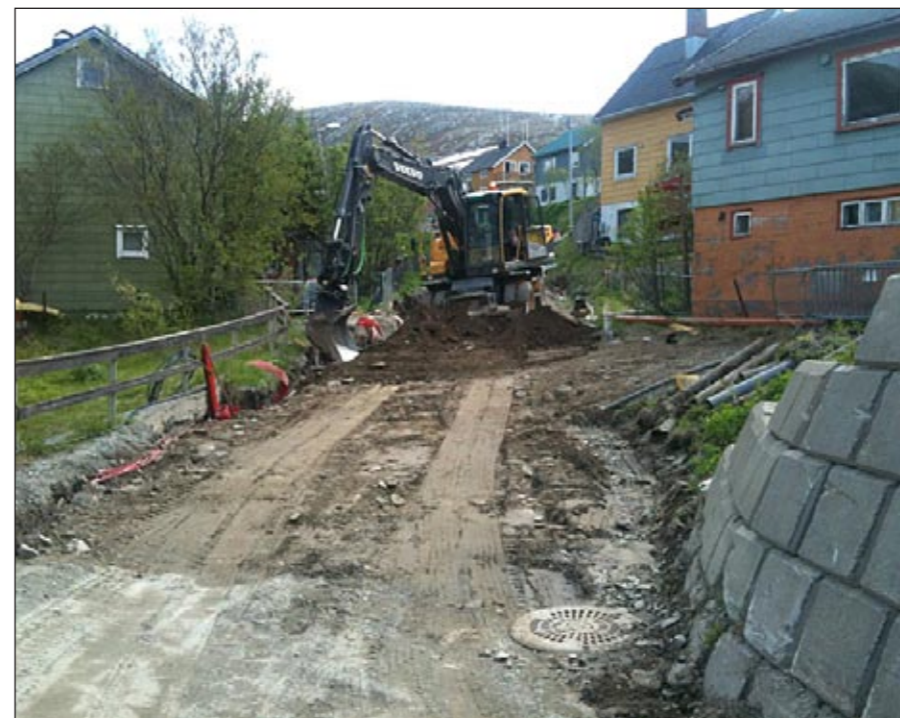
Utsiftingen av vannrør fortsetter etter to års opphold.

Lebesby er invitert som en av fem pilotkommuner i Finnmark, til et nytt prosjekt i regi av Innovasjon Norge. Prosjektet har som hovedfokus å bidra til styrking av Førstelinjetjenesten for Utvikling av Næringsliv i Kommunene (FUNK). Oppstart blir høsten 2011.