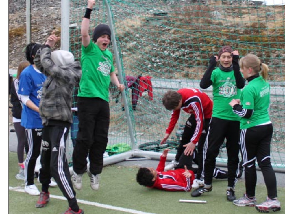
Det var mange jubel scener etter at deltakerne ga alt for å vinne.