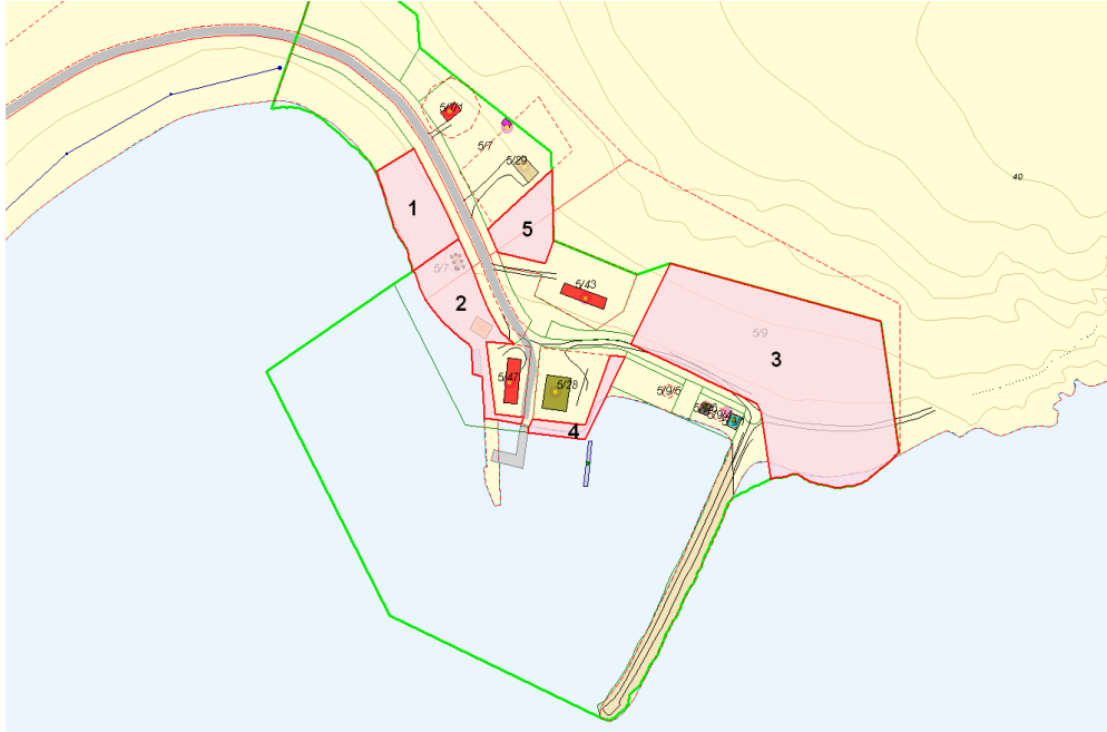
Omsøkte områder nr. 1 – 4 og nr. 5 (ikke omsøkt)