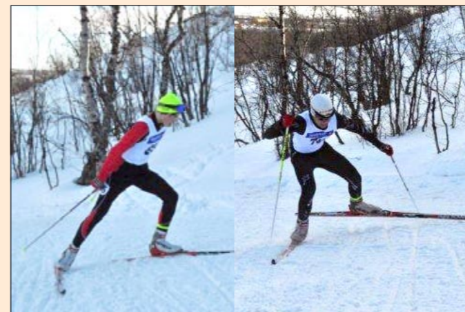
Konkurransenstinket er på topp.

4 gull og 1 sølv. Til sammen sanket gjengen med seg hele 17 medaljer av ulikt valør, en flott prestasjon.