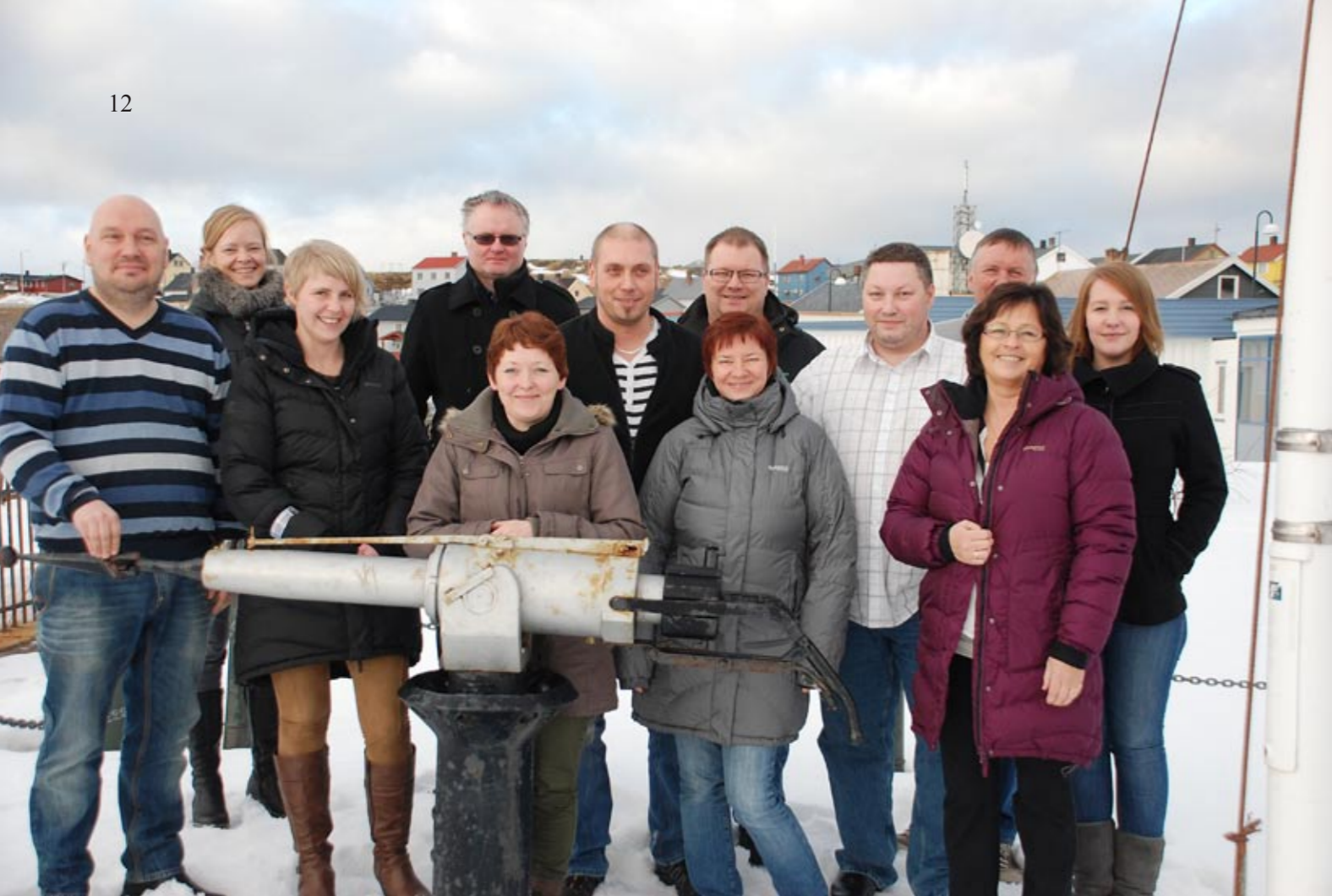
Kursdeltakerne var på oppstartssamling i Mehamn den 21. mars