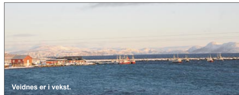
Veidnes er i vekst.