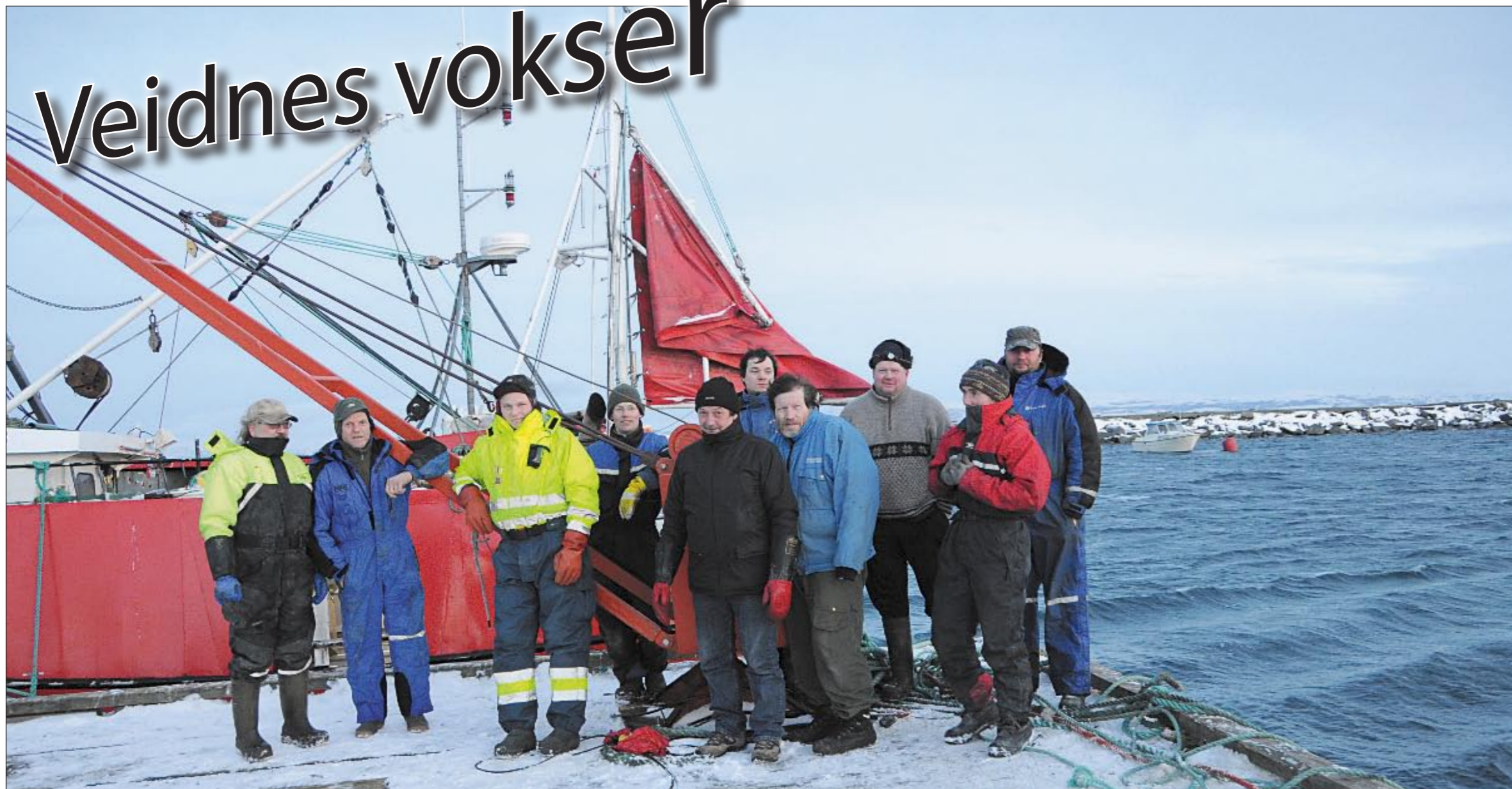
Veidnes har det siste året opplevd en stor oppblomstring i fiskerinæringen.

Det satses friskt på Veidnes, og mange nye båter og fiskere er registrert i bygda. Lebesby Kjøllefjord Havn KF har derfor besluttet å restaurere kaia og kjøpe ny kran.