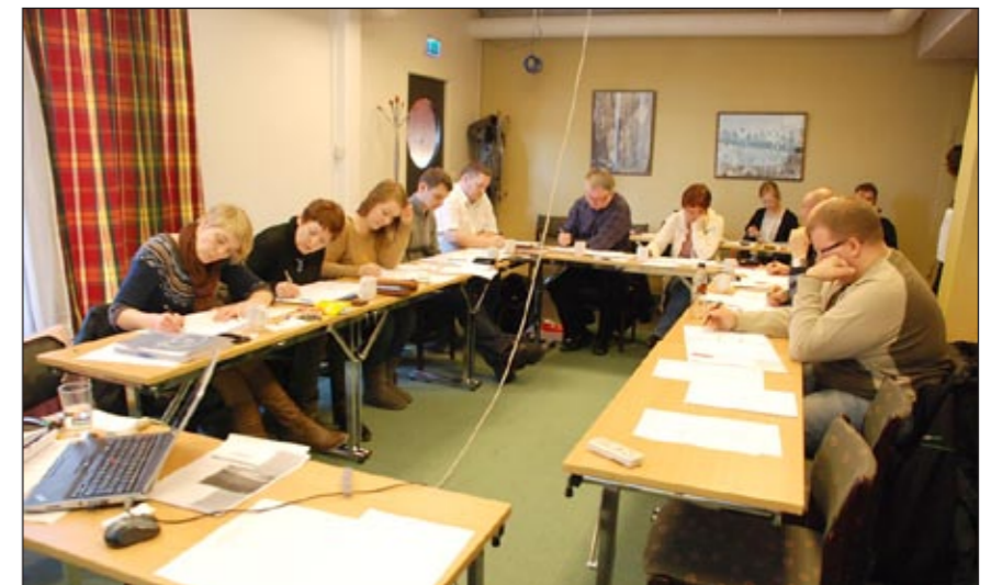
Deltakerne i dyp konsentrasjon i en av oppgave underveis i første samling