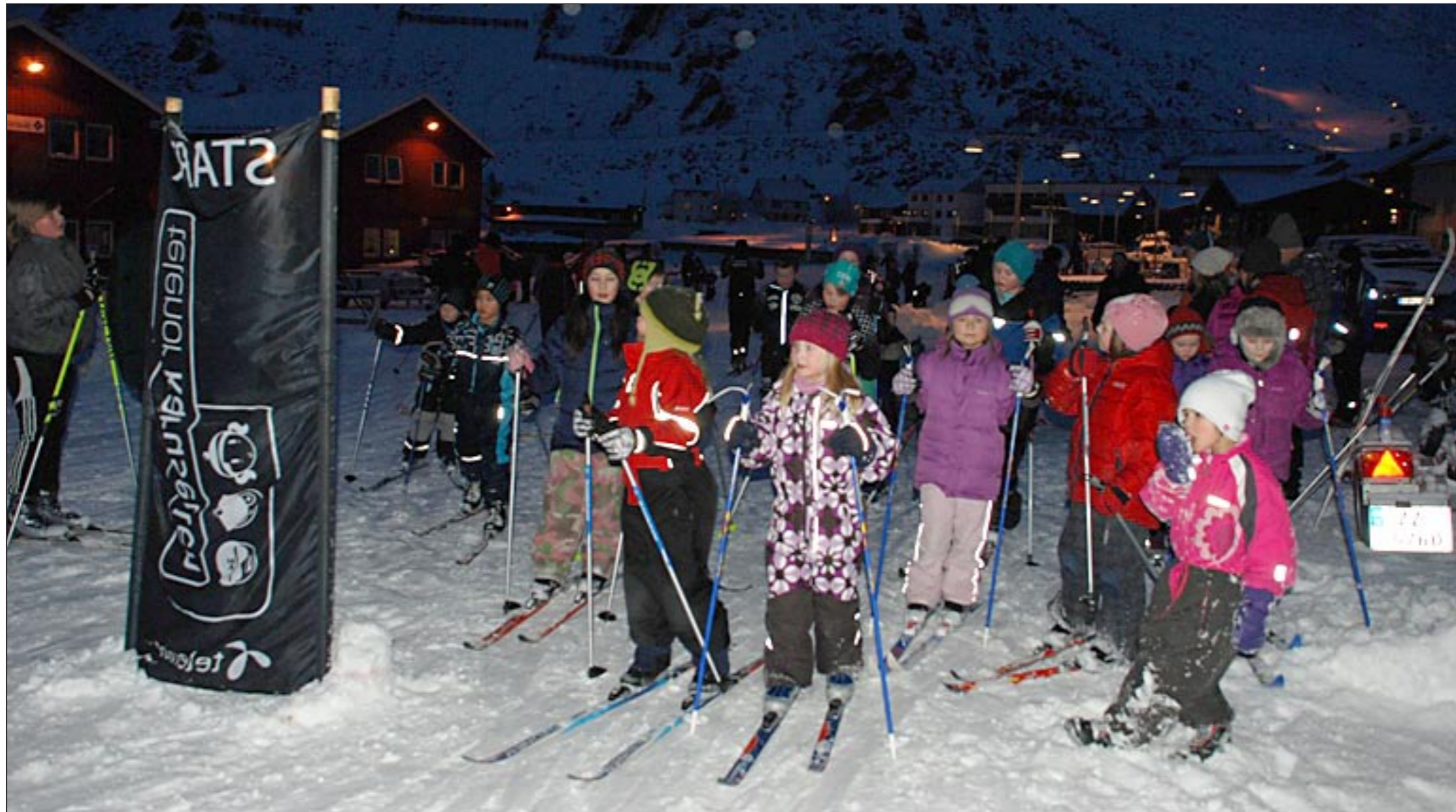
Mange ivrige skiløpere klar til start i Skikarusellen