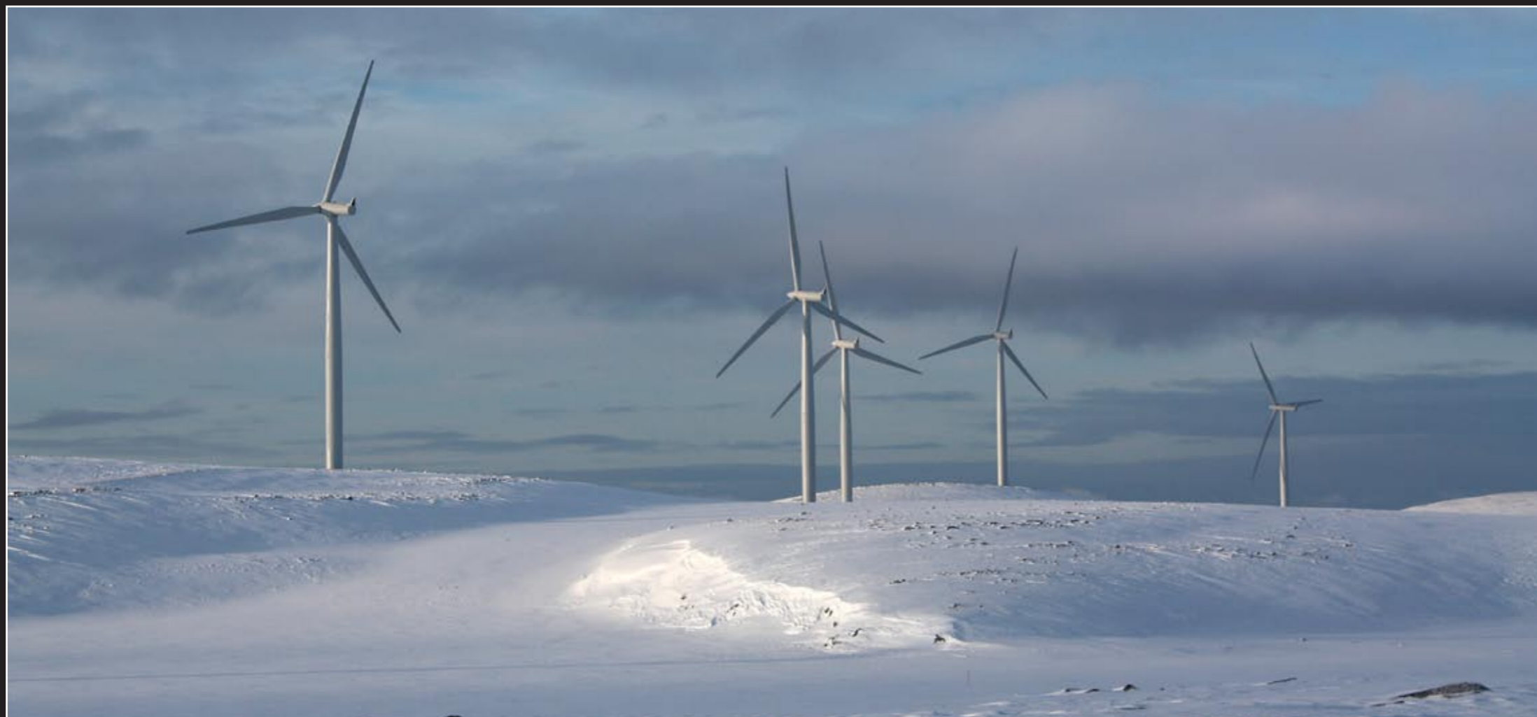
Vindkraft Nord ønsker å bygge en vindkraftpark sør for Kunes.

Utviklingsavdelingen arbeider med søknad til Kystverket om tilskudd til fiskerihavner, post 60 midler. Det søker om tilskudd til ny fiskerikari i Kjøllefjord, og søknadsfristen er 1. april. Det vil ikke komme svar på søknaden før statsbudsjettet legges frem til høsten.