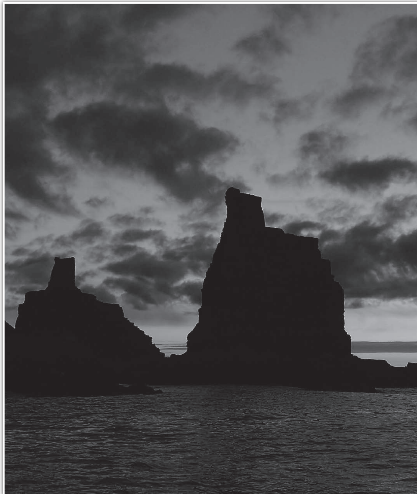
Finnkirka er selve motivet i kommunens kommunevåpen