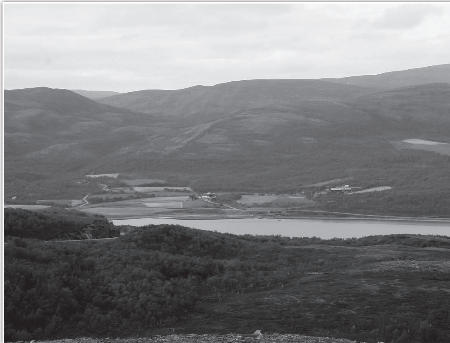
Bekkarfjord ble omtalt i en finsk reisebeskrivelse på 1920-tallet.

Søsteren til husets frue fulgte oss til Bekkarfjord. Vi spurte henne hva elva hette og fikk til svar «Sofie Evensen»! Hun tok oss hjem til seg i Bekkarfjord, hvorfra vi skulle ta oss videre til Honningsvåg. Hele familien fulgte oss ned til sjøen og moren rodde oss ut til en båt som lå oppankret og ventet på lokalbåten.