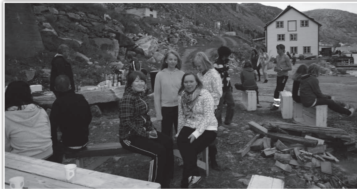
Ungdomsarrangementet trakk ca. 60 personer.

sang og spilte, og det ble arrangert biljardturnering. Ungdommen takker alle sponsorer for at de fikk muligheten til å arrangere ungdomsarrangement under festivalen!