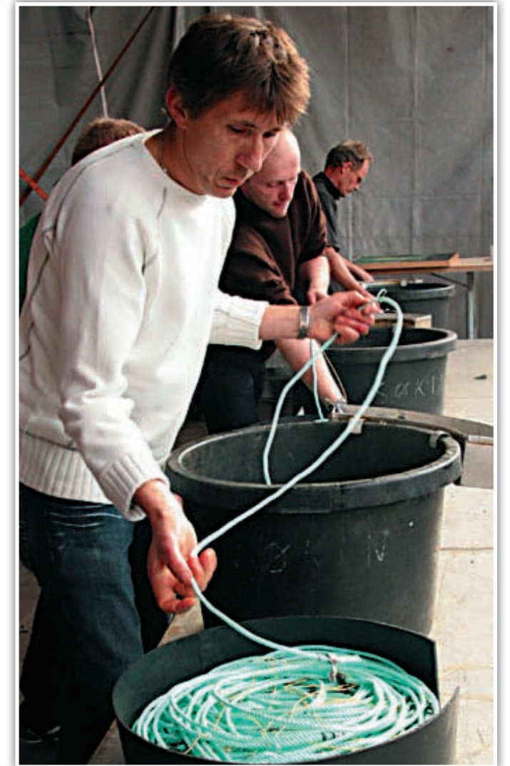
Konkurransen var knivskarp