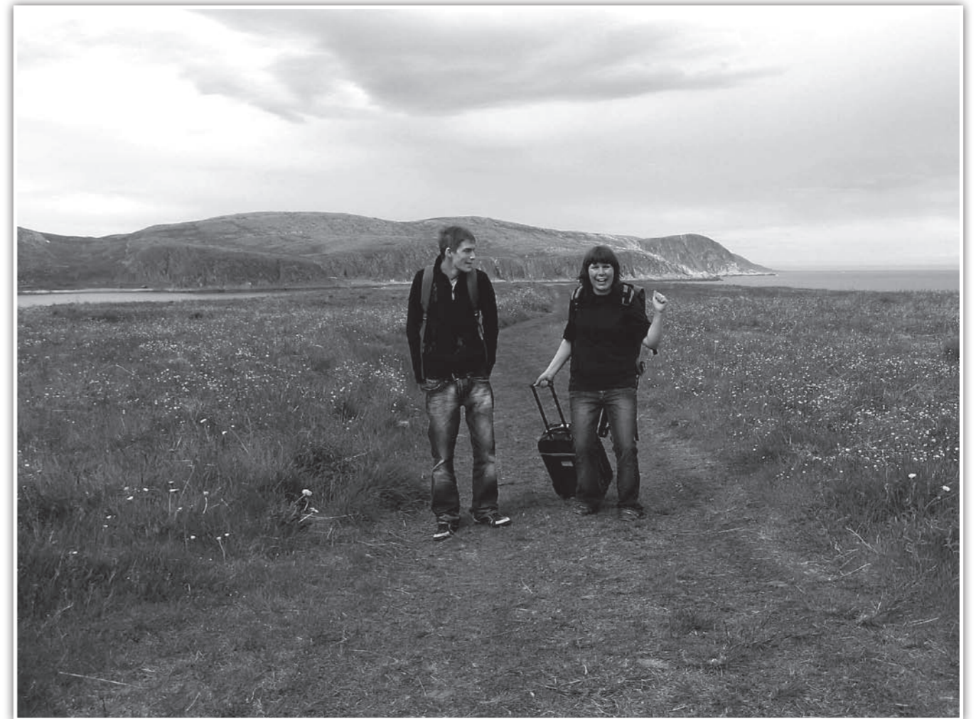
Folketallet i kommunen øker.

Som tidligere omtalt i media, så hadde vi hyggelig befolkningsutvikling i første halvår. Det etter mange negative kvartaler. Jeg håper at denne utviklingen vil fortsette, men vet samtidig at dette kommer til å svinge fremover. Vi har hatt en profil hvor vi sprer det gode budskapet om hjemkommunen der vi ferdes. Det er kanskje ett av de viktigste virkemidlene vi kan bruke. Vi vet alle at det er mange ting som kunne vært litt bedre, livet blir på en måte sjelden perfekt. Men la oss fokusere på de gode tingene og sammen gjøre noe med de tingene som kan bli bedre. Når vi sammenlikner oss med tilsvarende kommuner, så er faktisk Lebesby en god kommune å bo i.